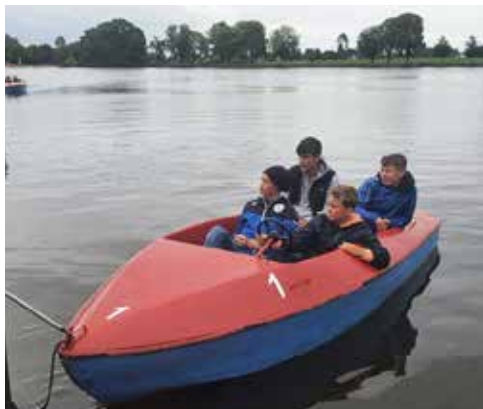
Konfirmanden auf dem Rantzauer See am 02. Juli