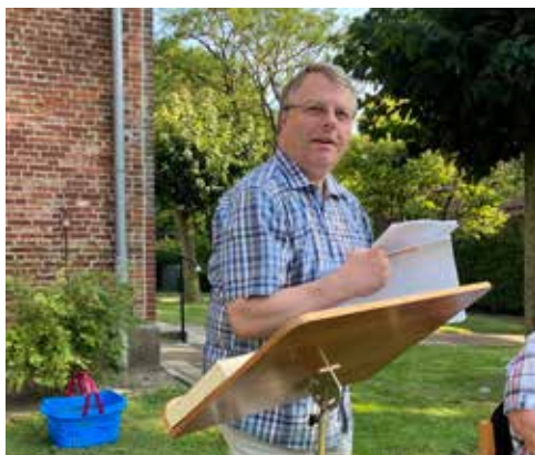
Sommerandacht am 31. Juli in Süderau