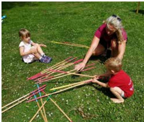
St. Annen Fest am 14. Juli 2024