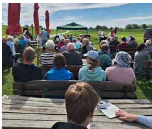
Pfingstgottesdienst am Hafen in Kollmar