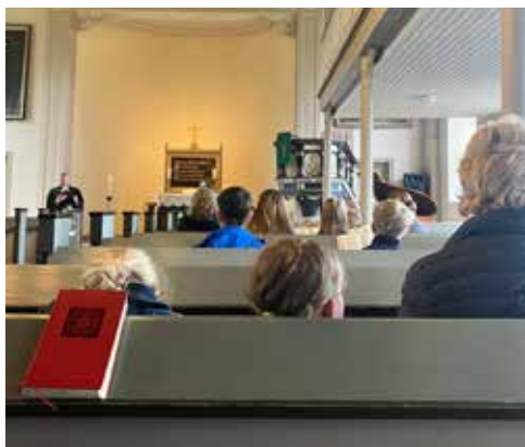
Kindergrün in Süderau am am 13. Juli