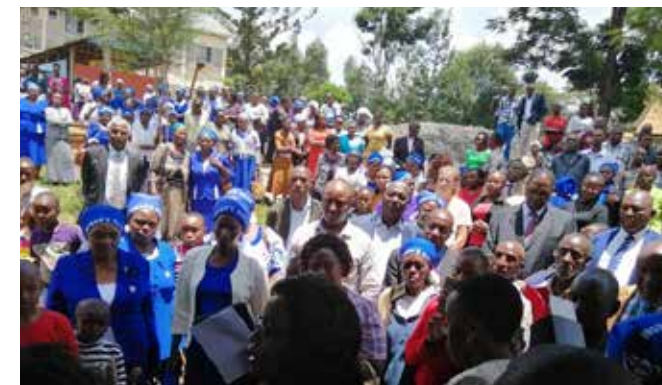
Die engagierten Frauen der „Woman´s Guild“ mit ihren blauen Kopftüchern waren im Jahr 2020 bei der Einweihungsfeier des neuen Mehrzweckgebäudes mit großem Speisesaal zahlreich vertreten.

So eine Begegnungsreise ist was völlig anderes als Briefeschreiben, Fotos schicken oder ´mal zu telefonieren. Auf einer Begegnungsreise kommt man sich näher, man spürt die Stimmungen, die Freude über Gemeinsamkeiten, aber auch die Alltagsorgen und die Herausforderungen, die die Lehrkräfte dort zu bewältigen haben. Zu solch einem Blick über den Tellerrand