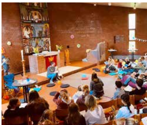
Kirche Kunterbunt am 16. Juni Kiebitzreihe